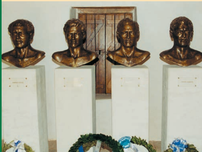
Οι προτομές των τεσσάρων αγωνιστών σε εσωτερική αίθουσα του αχυρώνα.

Η διαμόρφωση του αχυρώνα και της γύρω αυλής σε ενιαίο μνημειακό χώρο έγινε με πρωτοβουλία του Συμβουλίου Ιστορικής Μνήμης Αγώνα ΕΟΚΑ 1955-1959 σε συνεργασία με την Κοινότητα Λιοπετρίου. Τα σχέδια έγιναν από τον γλύπτη Νίκο Κουρούσι, που φιλοτέχνησε το μνημείο και τις προτομές, και την αρχιτέκτονα Μαργαρίτα Δανού.