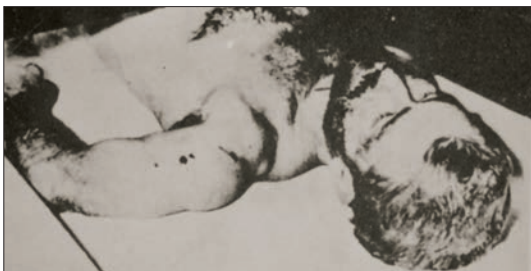
Ο Χρίστος Σαμάρας πέθανε με το χαμόγελο στα χείλη

Πήρε μέρος την 1η Απριλίου 1955 στην επίθεση που έγινε στη Δεκέλεια με υπεύθυνο τον Γρηγόρη Αυξεντίου. Την ίδια μέρα καταζητήθηκε και μέχρι τον θάνατό του έμεινε επικηρυγμένος για 5.000 λίρες. Σε όλο αυτό το διάστημα ανέπτυξε δράση στα χωριά Λιοπέτρι, Λιμνιά, Άγ. Σέργιο, Αυγόρου, Ορμήδεια, Περιστερωνοπηγή, Γαϊδουρά, Πυρκά και Πραστεϊό. Έπεσε μαχόμενος στον Αχυρώνα Λιοπετρίου για τα ιδανικά στα οποία πίστευε από την παιδική του ηλικία.