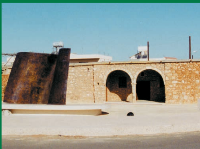
Ο ιστορικός αχυρώνας και μέρος της εμπρόσθιας αυλής όπως είναι σήμερα.